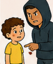
Qualquer toque nas partes íntimas