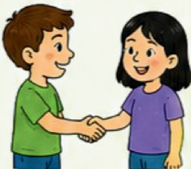
Aperto de mão